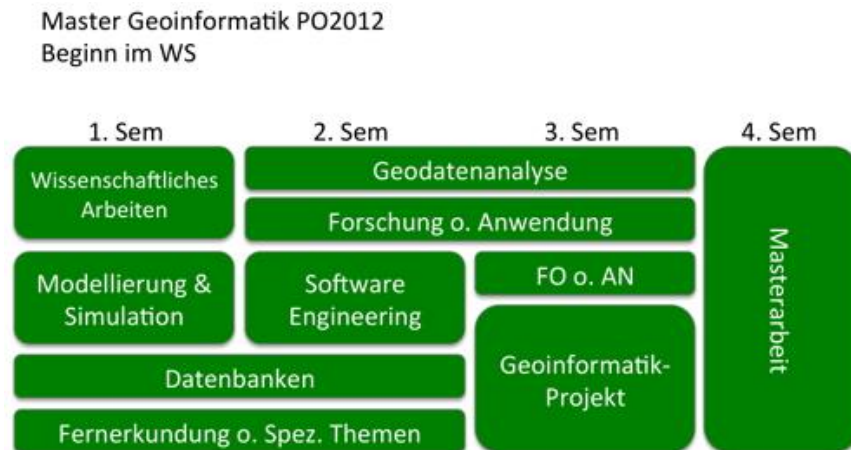
Abb. 1: Der viersemestrige Aufbau des Masterstudiengangs Geoinformatik

Der Masterstudiengang Geoinformatik wurde an der Universität Augsburg im SS 2012 genehmigt. Er ist als viersemestriger Studiengang aufgebaut, umfasst 120 ECTS (vgl. Abb.1) und schließt mit dem Master of Science (MSc.) Geoinformatik ab. Den genauen strukturellen Aufbau des Studienganges entnehmen Sie bitte der Prüfungsordnung (PO), die auf den Seiten des Prüfungsamtes als pdf-Dokument zur Verfügung steht.